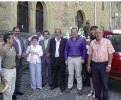
Como ya viene siendo habitual, la Agrupación de Transportistas Sorianos, organizó un completo y variado programa de actividades para conmemorar el día de

Ganado Porcino, denunciaron en una Jornada Informativa así como en una rueda de prensa, la situación caótica que está viviendo en la actualidad el mercado cerealista por la especulación realizada por los intermediarios, que constituye sin duda alguna, la crisis más grave que han sufrido las explotaciones en los últimos treinta años y que pone en grave peligro el sector porcino español.