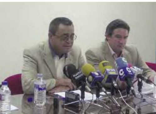
La Asociación Provincial de Productores de Ganado Porcino de Soria

(APORSO) alertó en agosto, a través de una nota de prensa a los medios de comunicación y a la opinión pública en general, de la grave crisis que está atravesando el sector, como consecuencia fundamentalmente de la fuerte subida de los precios de las materias primas, originando un incremento del 40% en los costes de producción.