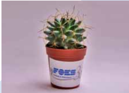
Día Mundial del Medioambiente. 5 junio 2008