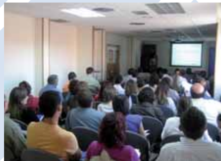
Jornada sobre el Registro de Empresas Acreditadas. 11 julio 2008