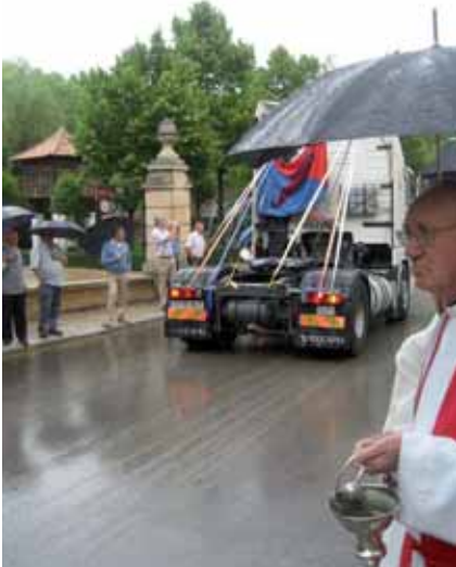
Una intensa actividad ha caracterizado la vida de la Agrupación durante los últi-

mos meses en los que sin duda alguna el máximo protagonismo ha venido marcado por el paro técnico que concluyó el pasado 13 de junio.