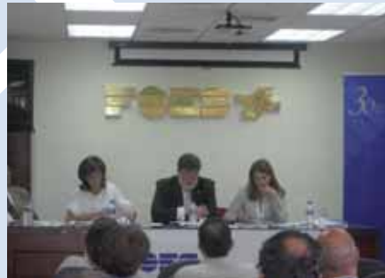
Asamblea General de FOES. 20 junio 2008