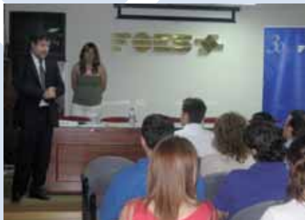
Clausura Curso Consultor en Sistemas Integrados de Calidad, Medio Ambiente y PRL. 23 junio 2008